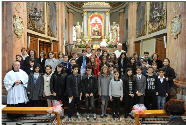
S. Cresime dell' 8 novembre - turno h 9.30