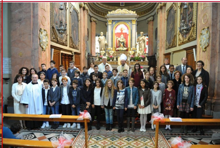
S. Cresime dell' 8 novembre - turno h 11.15